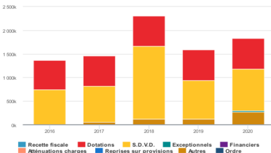
Répartition des recettes de fonctionnement